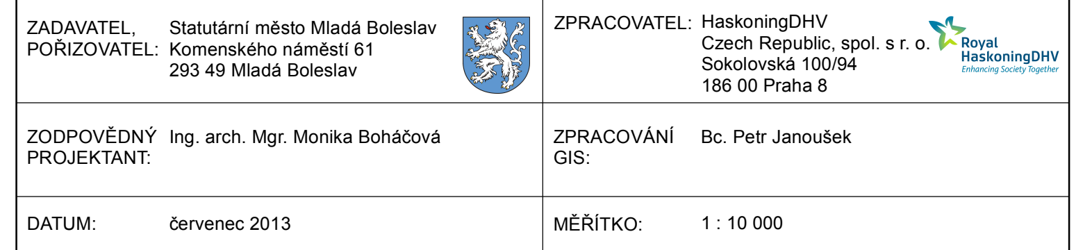
SCHÉMA VYMEZENÍ PLOCH