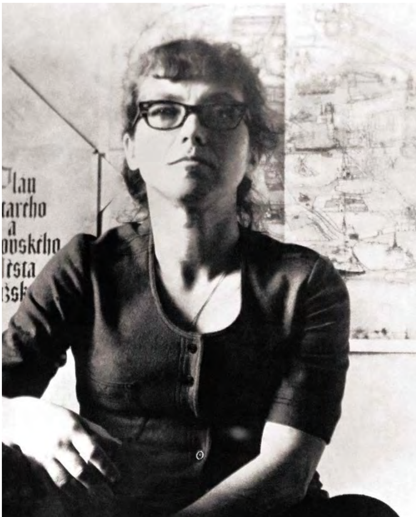
Natalie Gorbaněvská (1936)