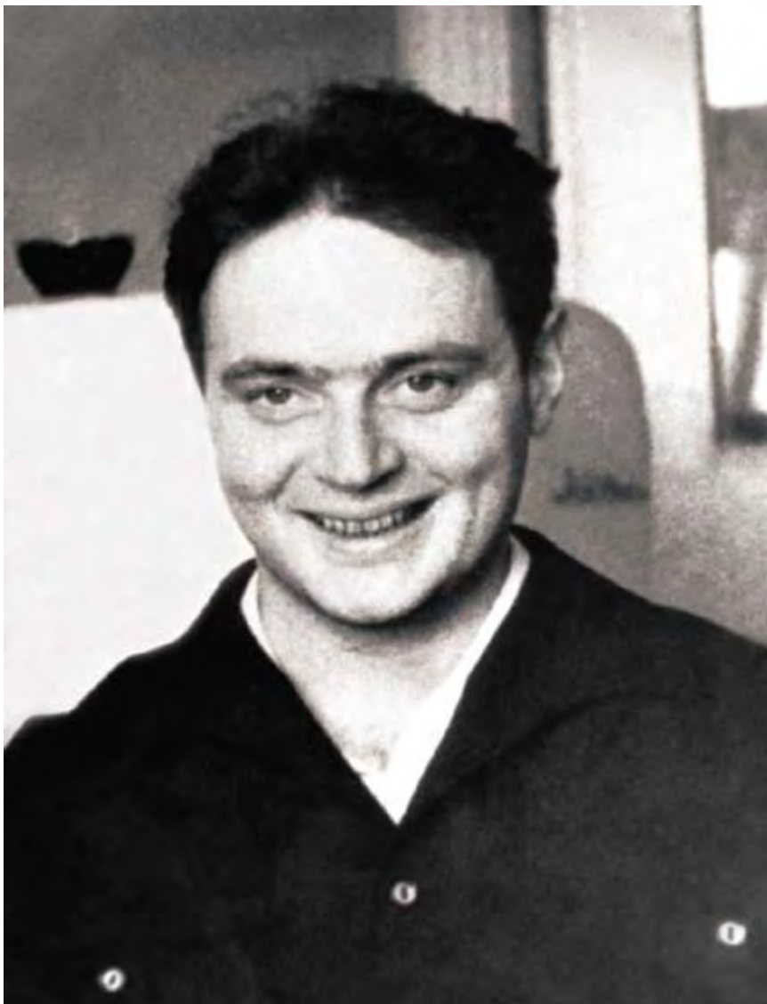
Pavel Litvinov (1940)

O čtyři dny později rozvinul během demonstrace na Rudém náměstí transparent s textem „Za vaši i naši svobodu“, který odrážel jeho naděje, že Pražské jaro ovlivní i vývoj v Sovětském svazu. Tajní příslušníci KGB ho při útoku na skupinku demonstrantů mlátili těžkou taškou přes hlavu. Stejně jako ostatní demonstranti byl zatčen a uvězněn. V říjnu 1968 byl odsouzen k pěti letům vyhnanství. Z věznic Lefortovo ho přes Sverdlovsk, Novosibirsk, Irkutsk a Čitu eskortovali až do městečka Usguli na Sibiři. Zde pracoval až do roku 1973 jako elektrikář v místních dolech.