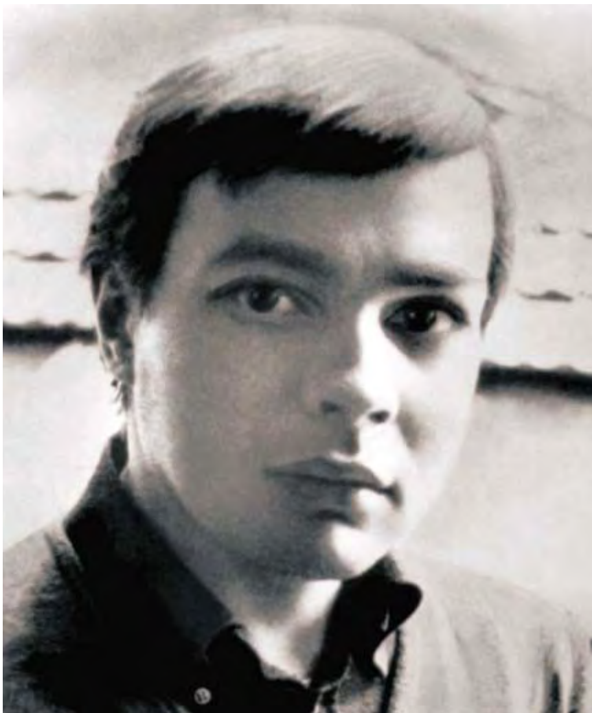
Vadim Delone (1947–1983)

Během demonstrace na Rudém náměstí 25. srpna 1968 byla zatčena, ale jako matku tříměsíčního syna ji na rozdíl od ostatních demonstrantů