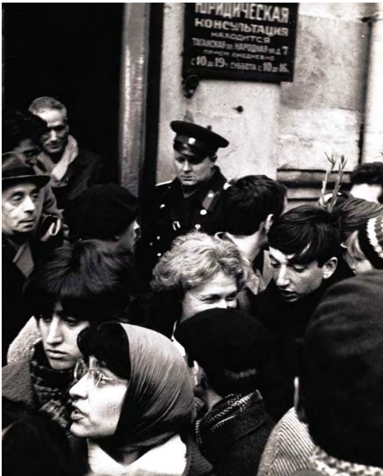
Před soudem s účastníky demonstrace na Rudém náměstí, Moskva, říjen 1968