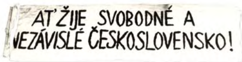
Transparent zabavený demonstrantům na Rudém náměstí.

Bylo jich osm. Před čtyřiceti lety se sešli na Rudém náměstí v Moskvě, aby demonstrovali svůj nesouhlas s politikou vlastní země. A zaplatili za to.