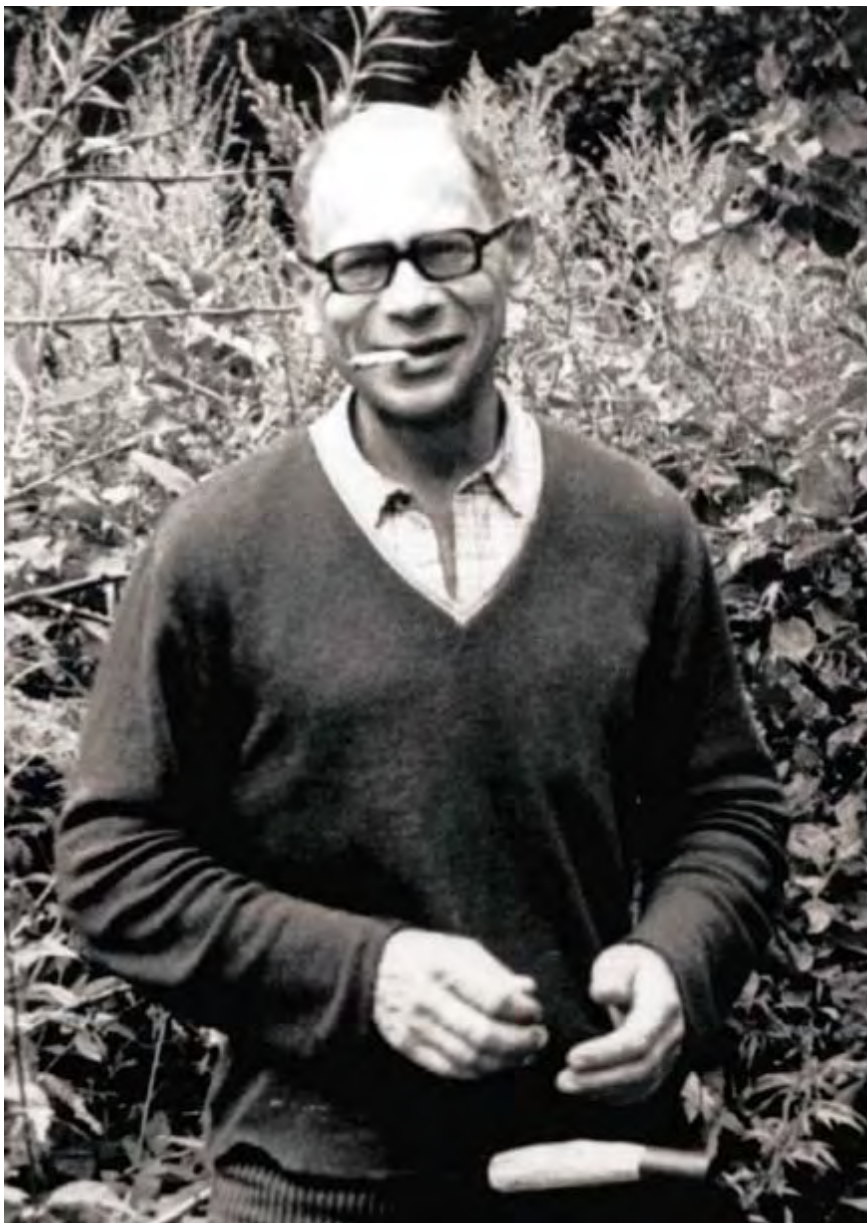
Konstantin Babickij (1929–1993)