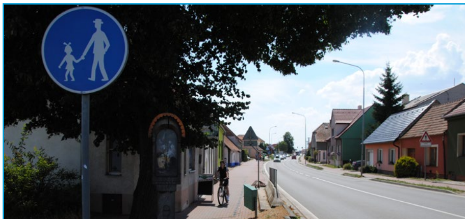
Na chodníku podél silnice I. třídy ve Veselí nad Moravou by měli cyklisté kolo vést.

Rodiče s malými dětmi vnímají svoji bezpečnost na silnici ještě citlivěji, a pokud není v daném místě vybudovaný cyklopruh nebo stezka pro cyklisty, jen málo z nich se pustí do běžného provozu. Zákon o provozu na pozemních komunikacích ale zakazuje jízdu na kole po chodníku všem cyklistům. V českých městech je stále řada míst, kde z různých důvodů není možné vytvořit bezpečné řešení a cyklisté tak zůstávají stát před rozhodnutím, zda překročit zákon nebo riskovat svoji bezpečnost. Více zde .